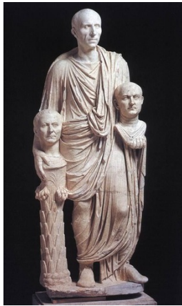
espressione che significa "capofamiglia"