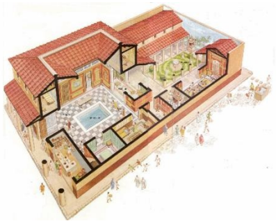
casa o famiglia in senso stretto