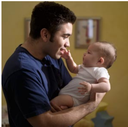
padre; al pl. significa anche "senatori"

20. potestas, -atis, f. s. potestà, autorità; era il potere del pater familias sui membri della sua famiglia