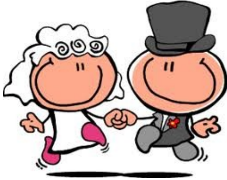
prendere marito, sposare (riferito alla donna)