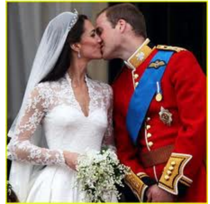
prendere moglie, sposare (riferito all'uomo)